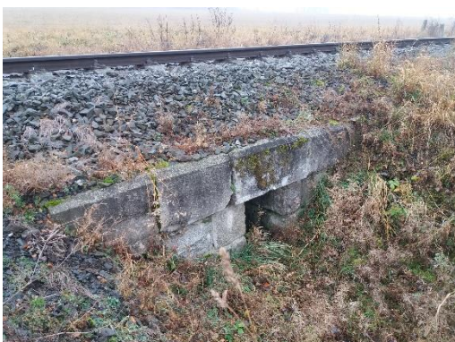
O 03 Pohled na výtok

Propustek je využíván pro převedení občasného vodního toku. Jedná se o jednokolejnou neelektrifikovanou celostátní trať.