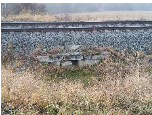
O 02 Pohled na nátok