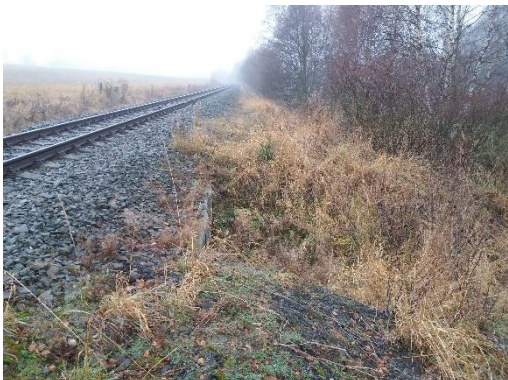
O 01 Pohled ve směru staničení